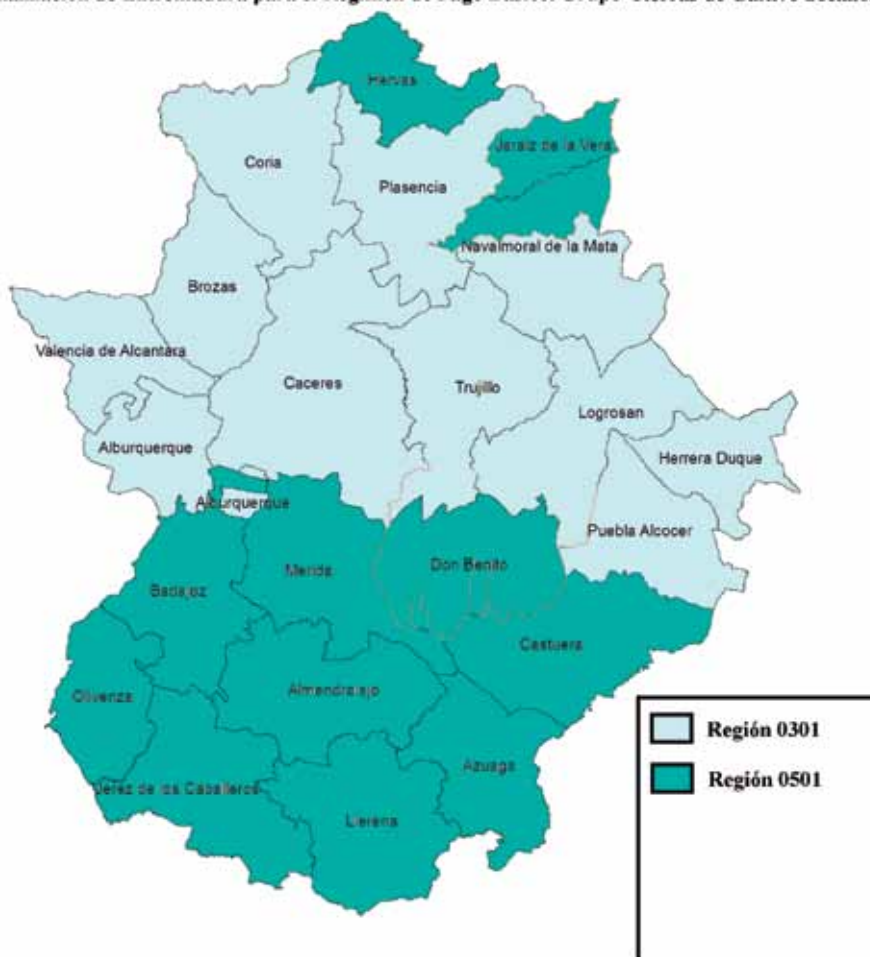
Regionalización de Extremadura para el Régimen de Pago Básico. Grupo Tierras de Cultivo Secano.