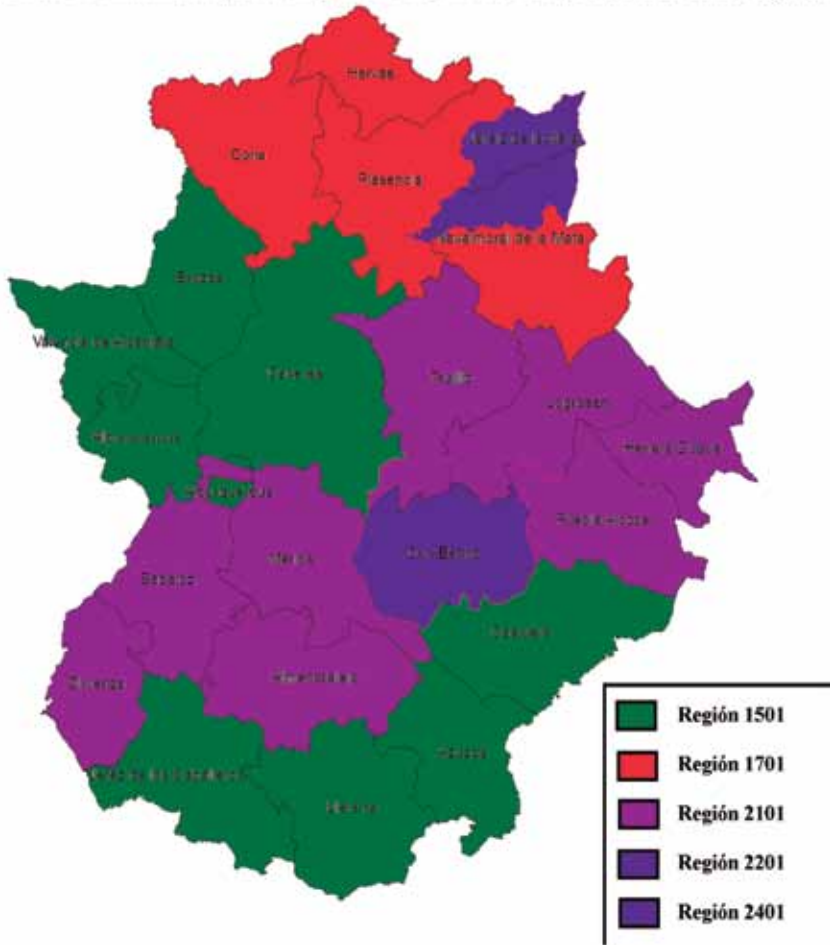
Regionalización de Extremadura para el Régimen de Pago Básico. Grupo Tierras de Cultivo Regadío.