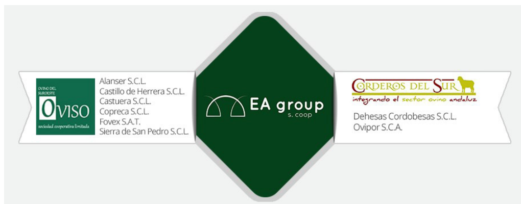
IMAGEN 1: Entidades integrantes de EA group s.coop