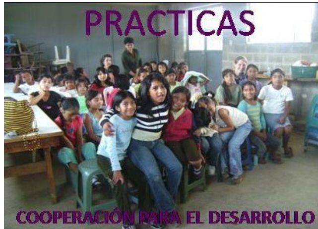
Alumna de la Facultad de Medicina de la UEx, participante del programa de prácticas de Guatemala

experiencia de Voluntariado, sensibilidad ante problemas de desarrollo, habilidades sociales y capacidad adaptativa, participación previa en actividades de la Oficina de Cooperación Universitaria al Desarrollo o/y otras entidades u organizaciones de desarrollo y conocimiento del idioma del país en el que realizara sus prácticas.