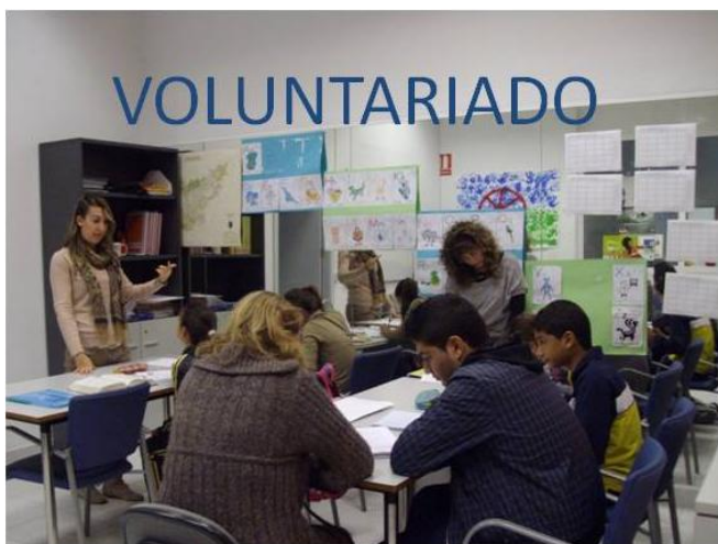
Voluntarias de la UEx en el Programa “Aulas Promociona” Con la Fundación Secretariado Gitano

Entre las diferentes formas de participación ciudadana , el voluntariado es una forma de colaborar un tanto especial, ya que supone un contacto con la realidad más permanente y con grandes dosis de implicación personal.