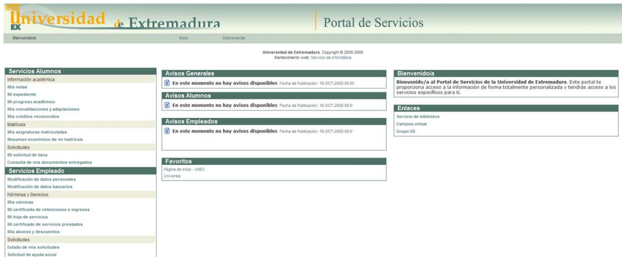
Figura 1. Aspecto del Portal de Servicios de la Universidad de Extremadura

El Portal de Servicios de la Universidad de Extremadura pone a disposición de los distintos colectivos de la Universidad un abanico de servicios telemáticos que les permitirán tener siempre accesible los datos necesarios para desempeñar la labor que le es propia dentro de la institución. Estos servicios se integran en un único portal capaz de ofrecer a cada usuario una vista personalizada de la información y los procedimientos que le atañen en virtud de los roles que desempeña en la Universidad (ver figura 1)