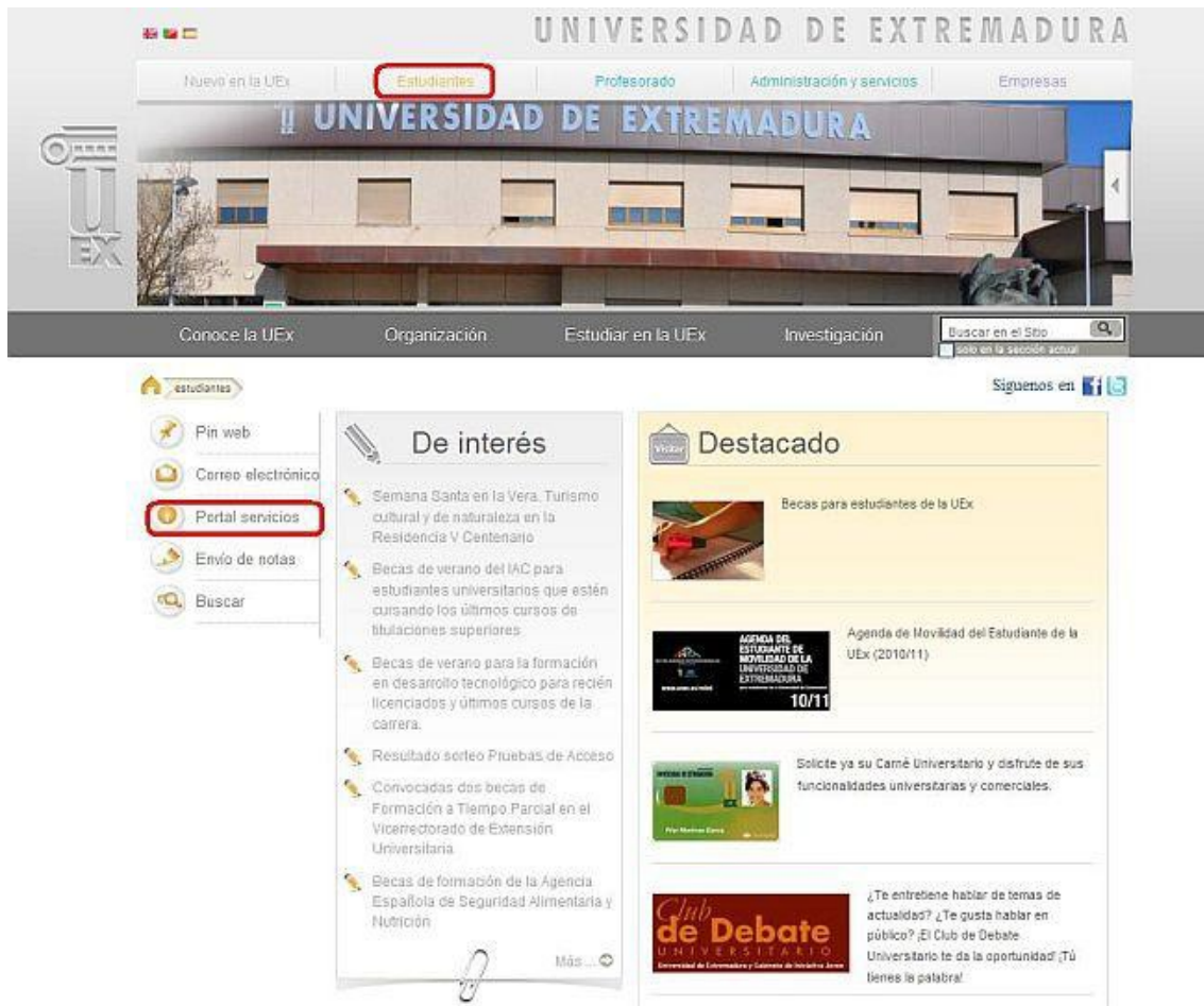
Figura 2. Acceso al Portal de Servicios de la UEx desde el perfil de Estudiante del Portal de la UEx

Para que el Portal de Servicios de la UEx pueda desplegar los servicios telemáticos es necesario deshabilitar el bloqueador de elementos emergentes. A continuación se describe cómo hacerlo en Internet Explorer y Mozilla Firefox.