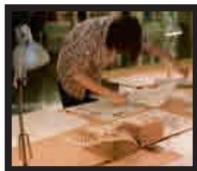
Escuela Politécnica Superior