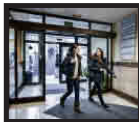
Facultad de Derecho