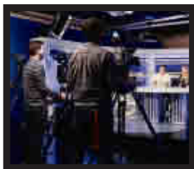
Facultad de Humanidades y CC. de la Comunicación