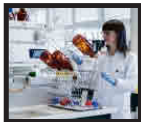
Facultad de Farmacia