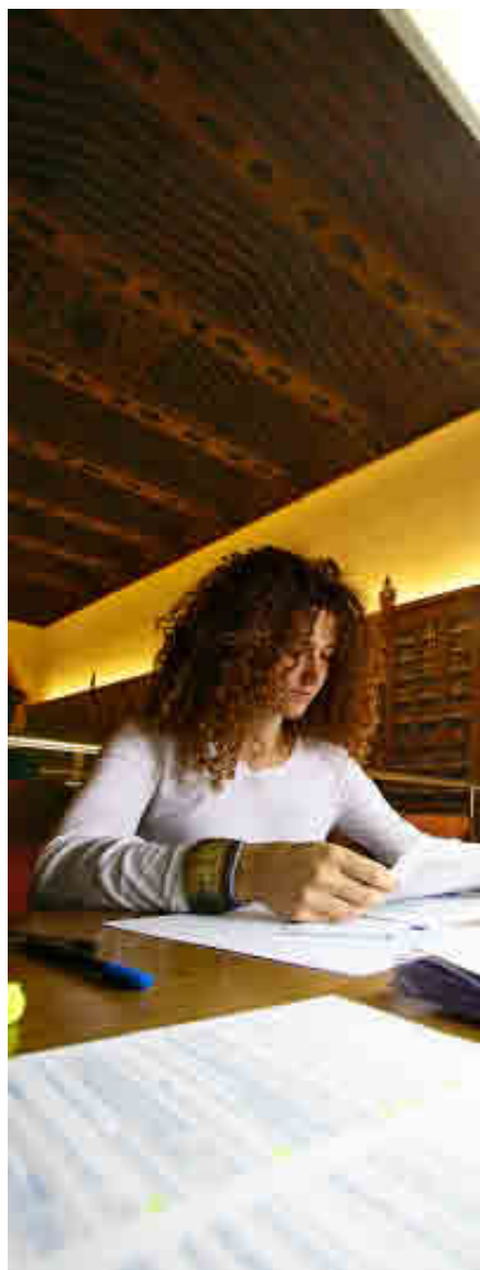
UNIVERSIDAD DE GRANADA

Tiene suscritos unos 80 convenios internacionales para el intercambio de estudiantes y profesores con centros de los cinco continentes.