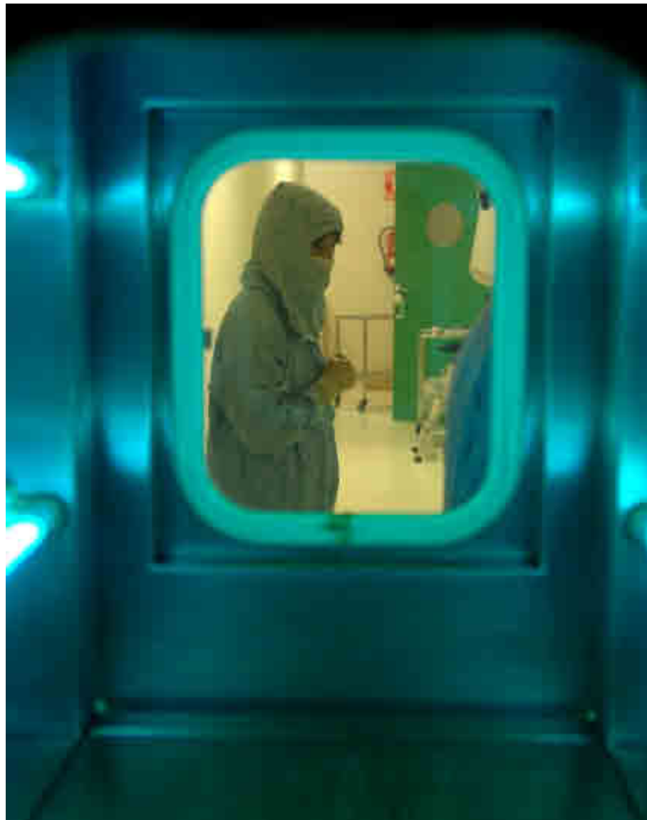
UNIVERSIDAD DE OVIEDO

La Universidad de Las Palmas de Gran Canaria ha sido distinguida con el Campus de Excelencia Internacional por su apuesta por un Campus Atlántico Tricontinental, que se basa en el desarrollo marino-marítimo como uno de sus ejes. De hecho, es referencia internacional en el estudio del mar.