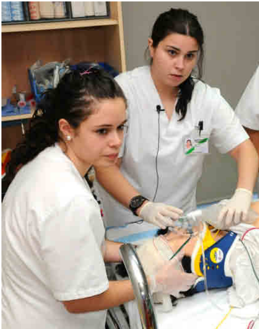
UNIVERSIDAD DE CANTABRIA