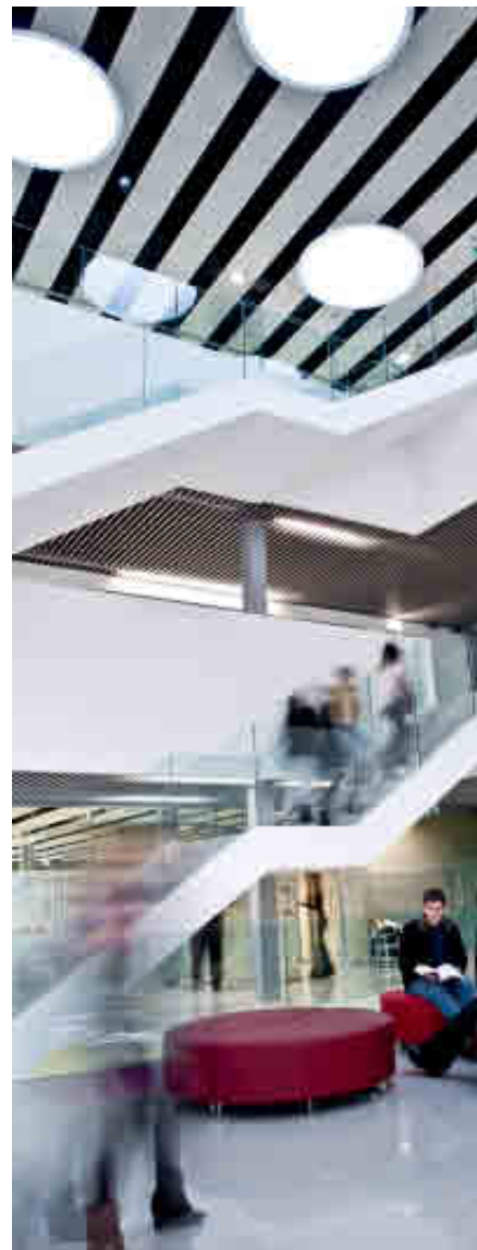
UNIVERSIDAD DE MONDRAGÓN