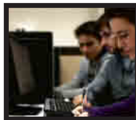
Facultad de Ciencias Económicas y Empresariales