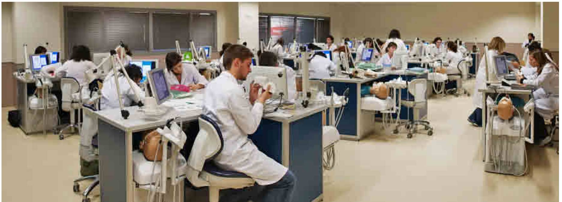
UNIVERSIDAD REY JUAN CARLOS