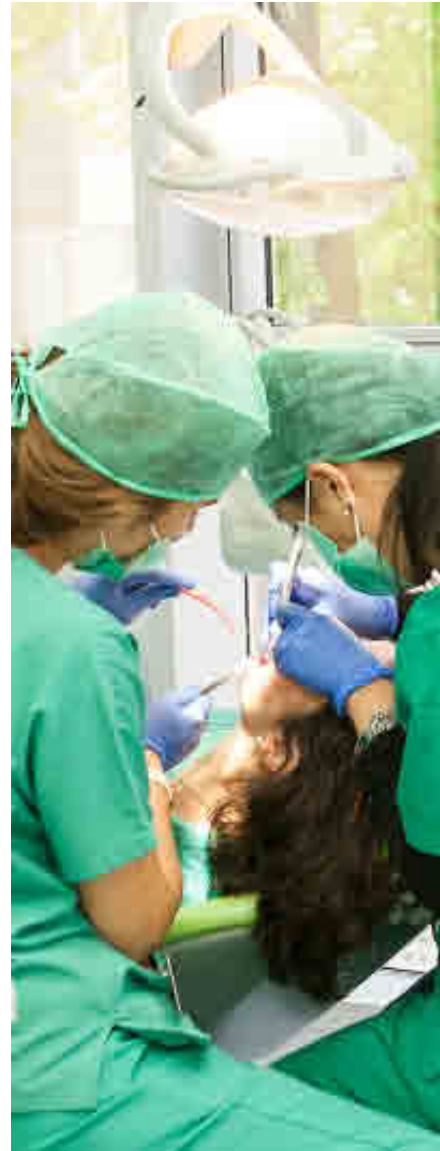
UNIVERSIDAD ALFONSO X EL SABIO

Para favorecer la inserción laboral de sus egresados, impulsa las prácticas externas, tanto curriculares como extracurriculares.