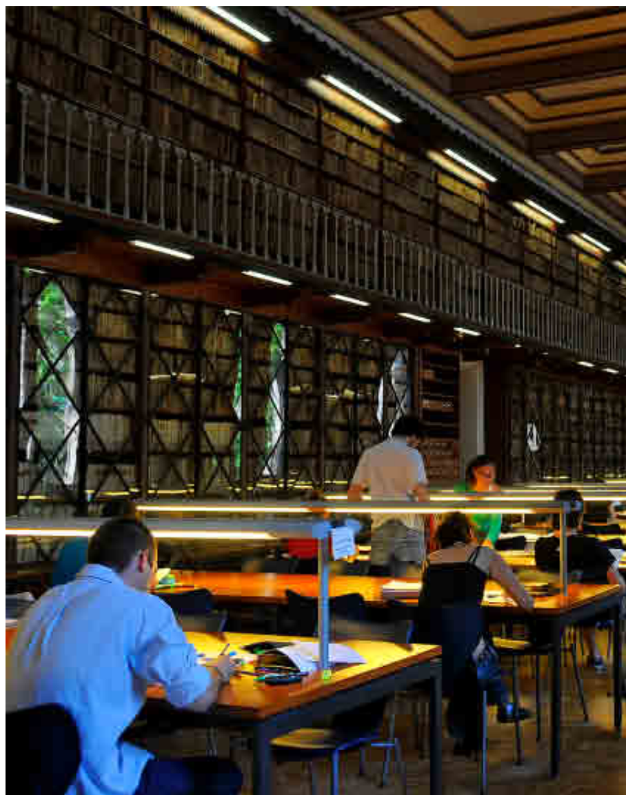
UNIVERSIDAD DE BARCELONA