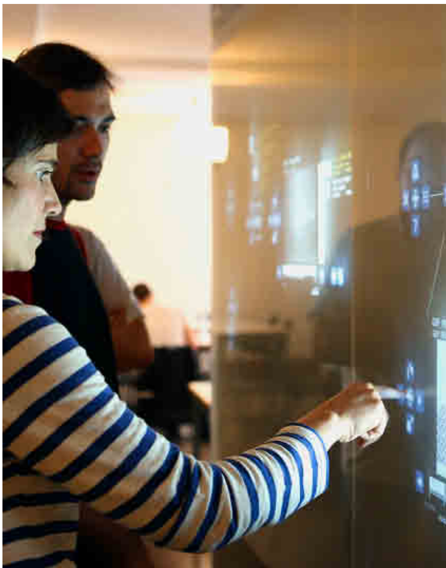
UNIVERSIDAD POLITÉCNICA DE MADRID

Los alumnos pueden elegir entre tres especialidades: Computación, Ingeniería de Computadores y Sistemas de Información.