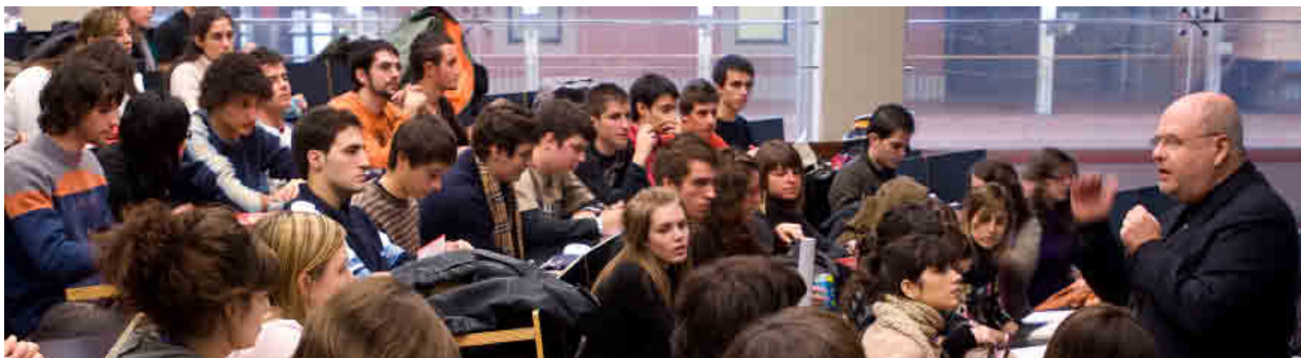
UNIVERSIDAD POMPEU FABRA