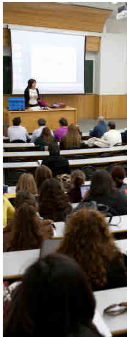
UNIVERSIDAD ALCALÁ DE HENARES

Los alumnos pueden completar hasta seis ECTS de prácticas profesionales en entidades colaboradoras como colegios y ayuntamientos.