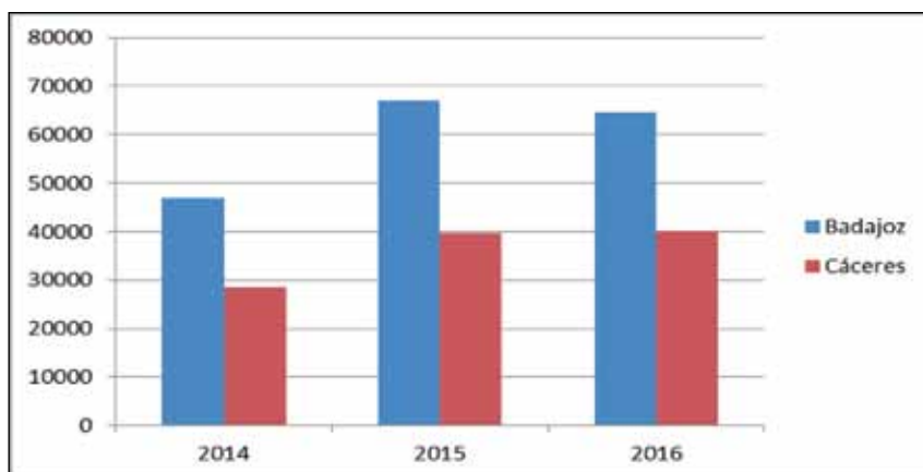
FIGURA 2: Cuentas de partícipes por provincias