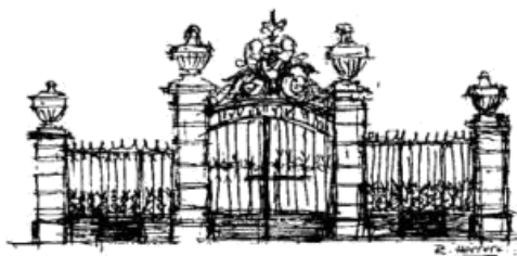
Escuela de Ingenierías Agrarias