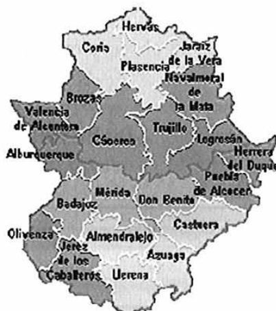
CUADRO 8: Distribución comarcnal de las cooperativas agrarias inscritas

En el cuadro 8 se presenta la distribución territorial de las cooperativas agrarias extremeñas inscritas en 2005 en el Registro de Cooperativas de la Dirección General de Trabajo de la Junta de Extremadura, agrupadas por comarcas agrarias.