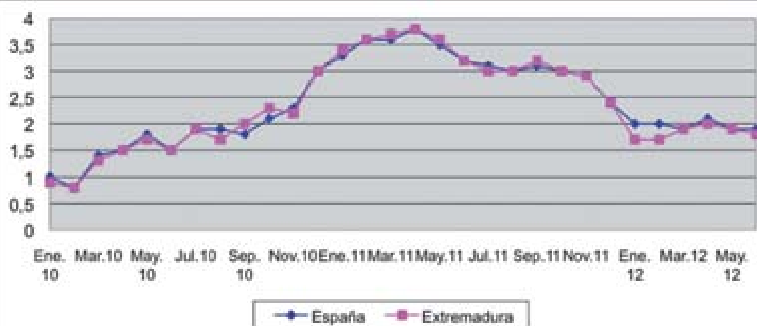
GRAFICO 2: Evolución del IPC general, base 2006. España y Extremadura

En la media del año, el alza de los precios afectó principalmente a las bebidas alcohólicas y tabaco, transporte y vivienda. En cambio, se registraron variaciones negativas en los sectores de la medicina, comunicaciones, ocio y cultura y vestido y calzado.