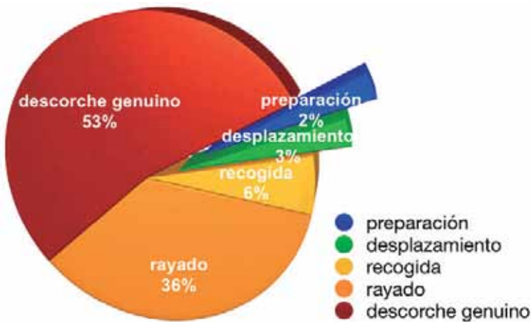
GRÁFICO 2: Desglose de tiempos relativos de las principales tareas de descorche