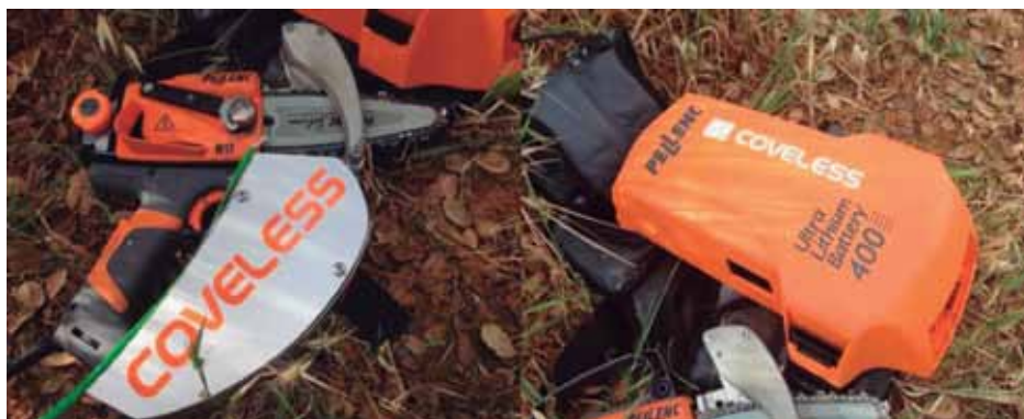
FOTO 4: Prototipo de la empresa COVELESS: a la izquierda la máquina de descorche, a la derecha la batería

Todas estas máquinas realizan el corte del corcho en árbol (fases de abrir y trazar), pero para completar el descorche es necesario desprender las planchas del árbol (fases de ahuecar, dislocar y separar). Con este objetivo, el Instituto del Corcho, la Madera y el Carbón Vegetal del CICYTEX, ha desarrollado varias herramientas manuales que permiten completar el descorche iniciado por alguna de las máquinas anteriores: