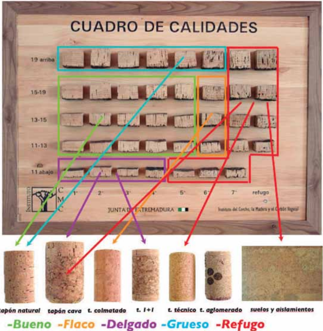
FIGURA 2: Resumen de las calidades de corcho y los destinos industriales de cada una de ellas

La clase denominada “bueno” (también “taponable” o “enrasado”), es la más apreciada por la industria taponera, pues de ella se obtienen los tapones de corcho natural, los más valorados y mejor pagados por la industria del vino. También es bastante apreciada la clase “delgado”, de donde se obtienen los discos y arandelas para tapones de cava y tapones 1+1. Menos apreciada es la clase “gruoso”, pues aunque de ella se obtienen tapones naturales y de dimensiones especiales, también resulta un porcentaje mayor de desperdicio, pues sólo se puede picar una fila de tapones en cada rebanada. La clase “flaco”, es de la que se obtienen los tapones