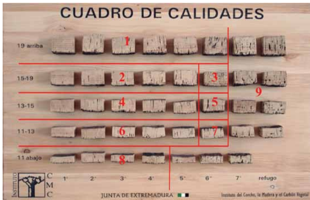
FIGURA 3: Cuadro de calidades de corcho con la clasificación tradicional de la industria de 9 clases