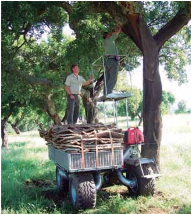
FOTO 7: Carguero forestal IPROCOR utilizado en trabajo de descorche con nuevas tecnologías