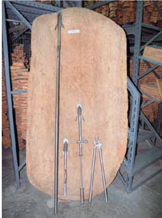
FOTO 5: Herramientas de descorche diseñadas por IPROCOR. De derecha a izquierda: tenazas corchera, mijuro percutor, mijuro corto y mijuro largo o de pértiga