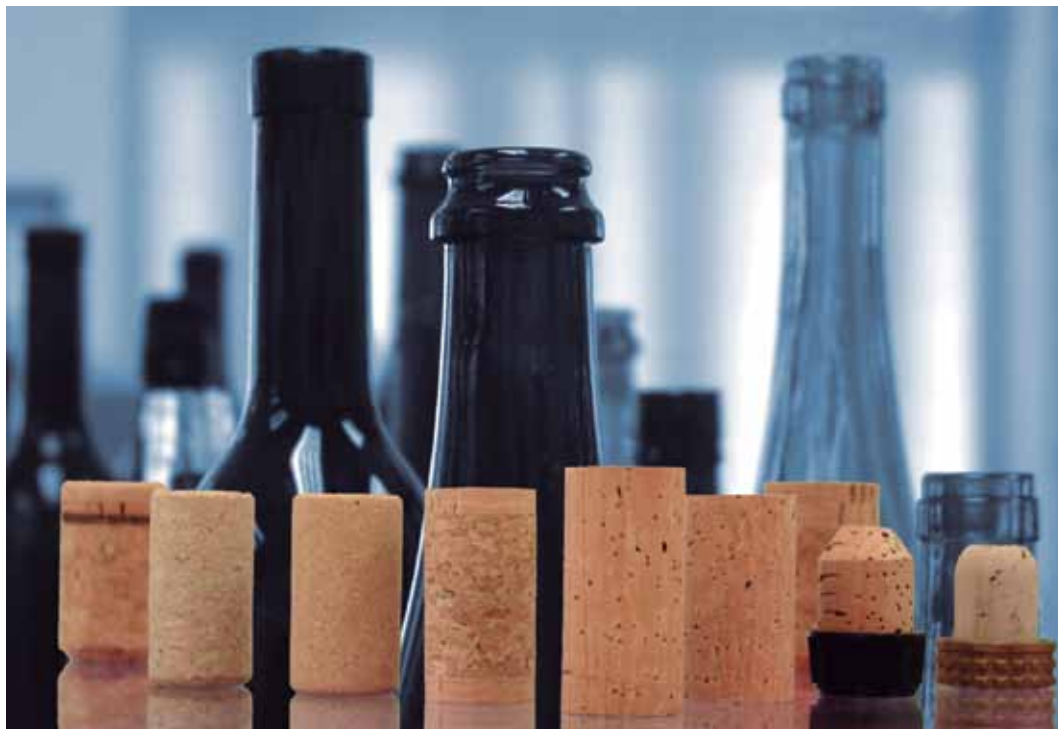
FIGURA 1: Diferentes tipos de botellas y tapones de corcho

Los tapones son (en general) las manufacturas que más aumentan el valor de un lote de corcho. La capacidad de tapamiento es por lo tanto el elemento base para establecer la calidad de corcho, incluyendo el comportamiento sensorial en relación con el vino.