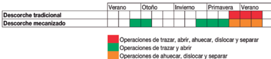
GRÁFICO 3: Cronogramas del descorche tradicional y del descorche mecanizado