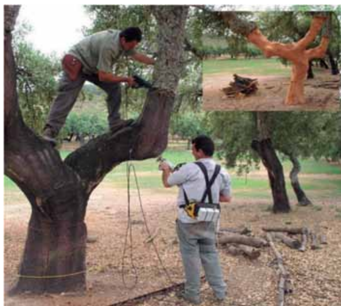
FOTO 6: Descorche con nuevas tecnologías: Operación de abrir, el sacador de arriba con la máquina IPLA y el de abajo con la máquina Stihl