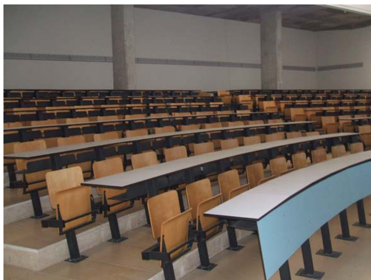
Estado actual Aulas a dividir