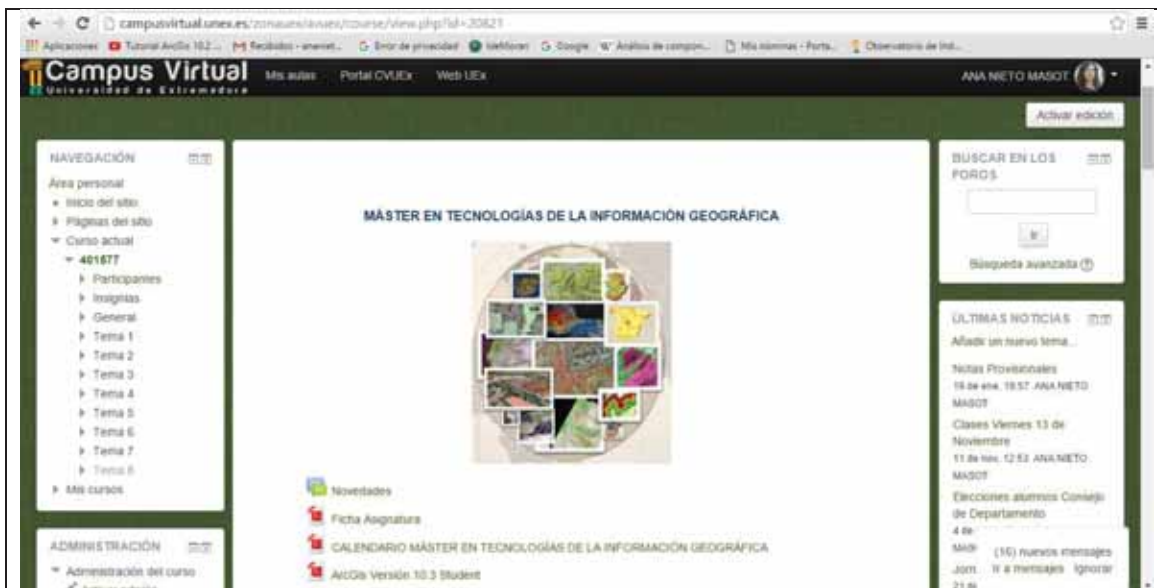
Figura 2: Ejemplo de página web de la asignatura de Aprendizaje Avanzado en SIG Vectoriales