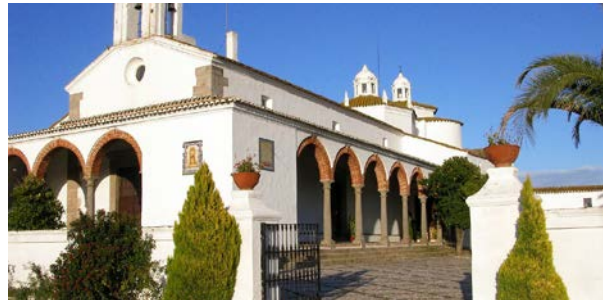
Santuario de nuestra Señora de los Remedios

La última ruta realizada ha tenido lugar en enero 2018. Ha sido la número 55 por el bonito pueblo de Fregenal de la Sierra. Ruta Los Molinos , de 8 km, desde el pueblo al Santuario de nuestra Señora de los Remedios, ruta preciosa y con poca dificultad,