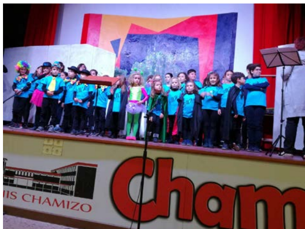
Coro de Arte vocal infantil de Villanueva de la Serena

El acto finalizó con la intervención del Coro de Arte Vocal Infantil de Villanueva de la Serena.