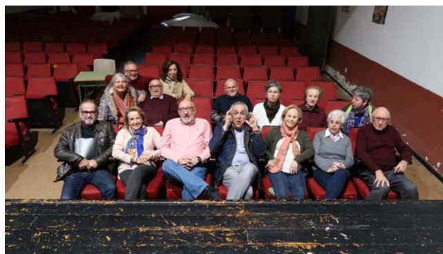
Grupo TUMCAC de la sede de Cáceres

Abrió el acto, así mismo en Mérida, el Coordinador de la UMEX, antes de la actuación del Coro "Canta Calvario" del Centro de Mayores