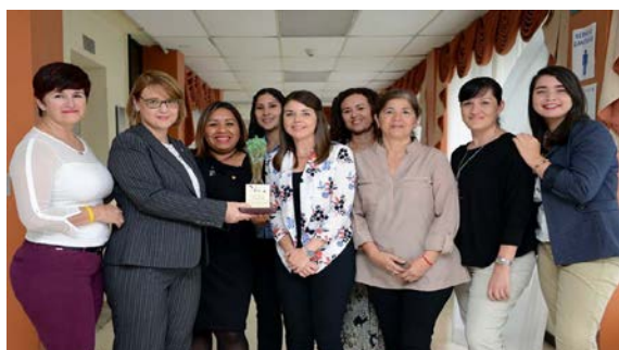
Equipo gestor del PIAM de la Universidad de Costa Rica (UCR)

Como devolución de esa visita en este caso y ahora con motivo del XX Aniversario de nuestra Universidad de Mayores (UMEX), un grupo de 28 alumnos extremeños han compartido amistad y experiencias, entre el 3 y el 17 de septiembre de 2018, no solamente en las aulas de la UCR sino también en la incomparable universidad natural que es aquel hermoso y acogedor país. Una extraordinaria actividad con la que la UMEX iniciaba los actos de celebración del XX Aniversario de su nacimiento. Nuestro agradecimiento al extraordinario equipo del PIAM por su excelente acogida y maravilloso programa que nos prepararon, en el que nos acompañaron a cada instante. Nuestros votos por que no sea el último intercambio PIAM/UMEX.