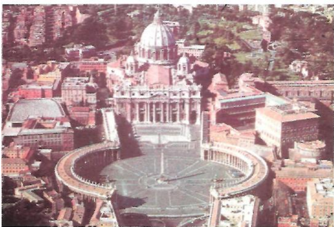
IMAGEN 3 A