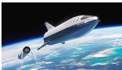
Space Exploration Technologies Corp.