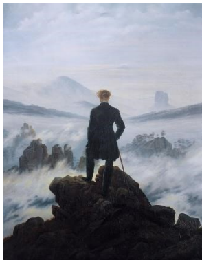
El caminante sobre el mar de nubes (Caspar David Friedrich)

En resumen: Tienes la oportunidad de pensar por ti mismo/a. Pero el pensar por uno/a mismo/a no es decir una ocurrencia, sino hacerlo teniendo en cuenta tus conocimientos y usando tus capacidades. El tipo de reflexión que se te pide tiene que ver con “pensar” la filosofía del autor conectada con el mundo actual.