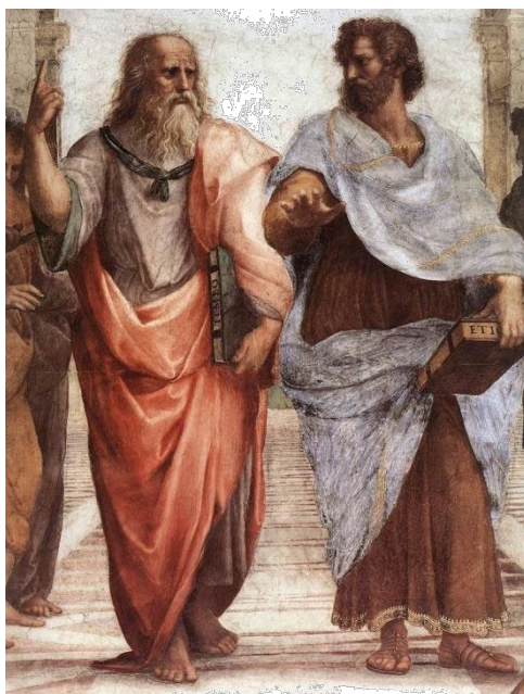
Escuela de Atenas (Rafael)

En resumen: Explica lo que dice el autor y cómo lo dice y para ello usa tus conocimientos sobre su filosofía. Si para explicarte bien necesitas citar otros autores, adelante, si no lo consideras oportuno, bien también.