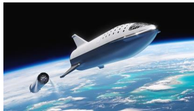
Space Exploration Technologies Corp.