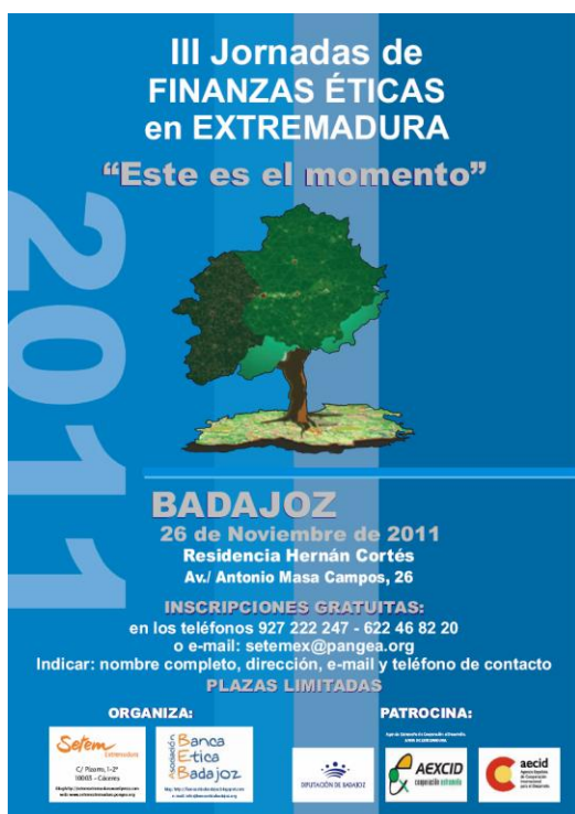
Cartel de las III Jornadas de Finanzas éticas

Las organizaciones SETEM Extremadura y Banca Ética de Badajoz continúan con el reto de difundir las finanzas éticas en Extremadura, poniendo en marcha las III Jornadas de Finanzas Éticas en Extremadura, el día 26 de noviembre en la ciudad de Badajoz, en el Colegio Mayor Hernán Cortés.