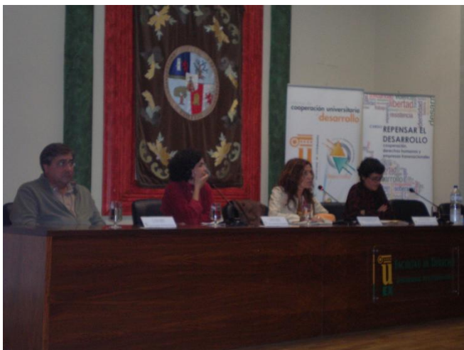
Acto de inauguración del curso. Cáceres. 24 de octubre

http://www.omal.info/www/article.php?id_article=4235