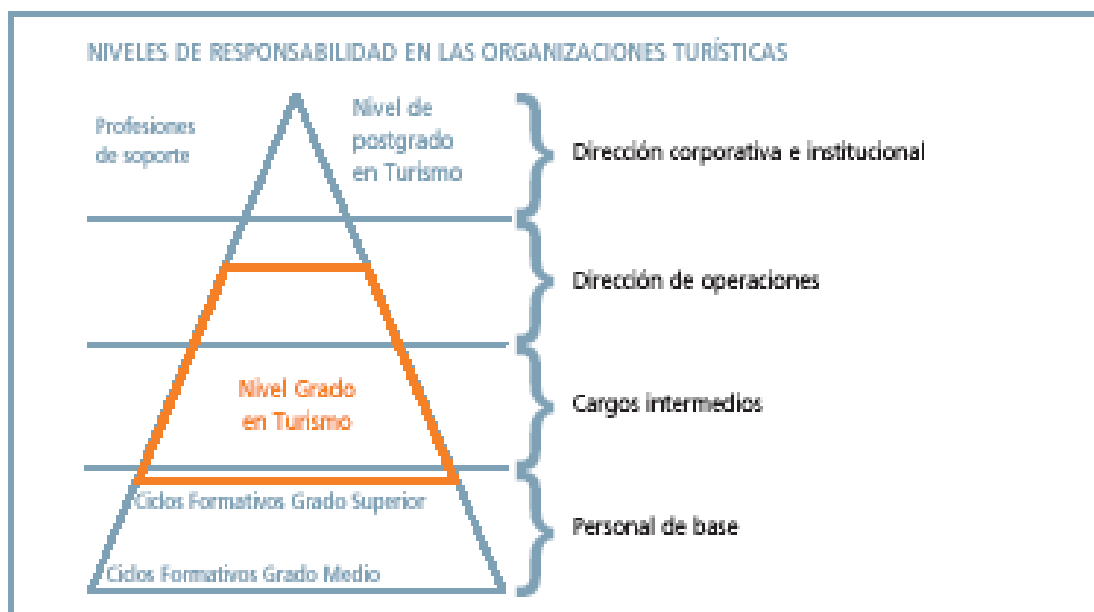
Figura 1. Niveles de responsabilidad de los titulados