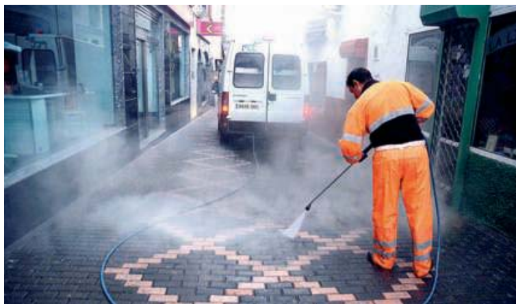
Un trabajador de FCC realiza labores de limpieza en la calle San Francisco.

El Ayuntamiento está recabando documentación para trasladar una oferta a la compañía. «No podemos pagar 760.000 euros todos los meses», afirma Saussol. Prueba