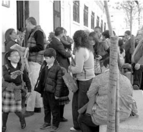
Alumnos de un colegio emeritense.

Desde el PSOE, el portavoz de Educación en la Asamblea, Luciano Fernández, afirmó que estas propuestas «son un golpe mortal para la calidad de la enseñanza en la comunidad». En nota de prensa, el PSOE se ratifica así en la afirmación que hizo ya a primeros del presente año referida de que «los Presupuestos del PP para el año 2012 en Extremadura preveían echar de la enseñanza a más de 400 profesores de instituto y casi 100 de cole-