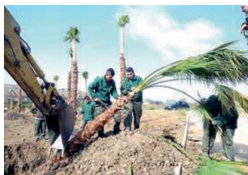
Jóvenes de la Escuela Taller ponen en pie una palmera.

Molina anunció que el mantenimiento de esta zona verde podría