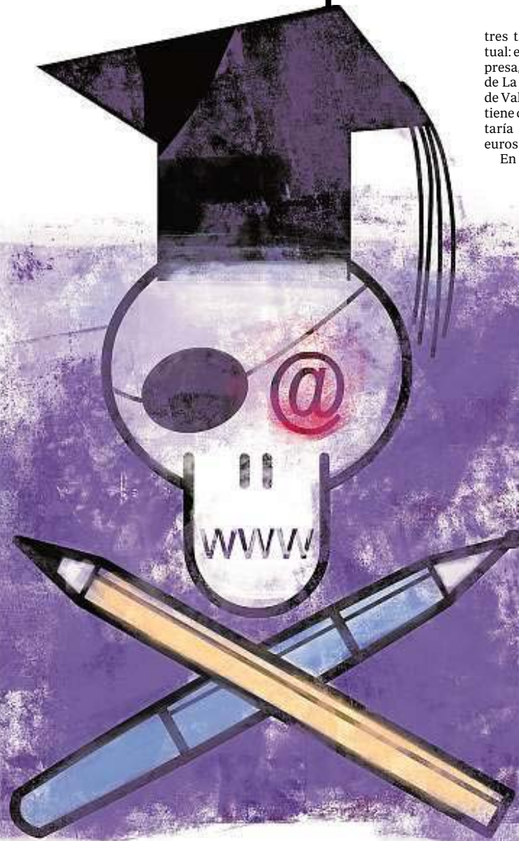
CARBAJO & ROJO

En la demanda, con la que persiguen el «reconocimiento del principio de propiedad intelectual de nuestros autores», CEDRO reclama que se deje de reproducir el material de sus socios en el campus virtual, que se retire el existente y que no se vuelvan a realizar copias ni sean subidas a la intranet de la UAB. La asociación reclama también una indemnización por daños y perjuicios en base a su tarifa de licencia, que actualmente es de cinco euros por alumno y año. «Para nosotros es importante que quede claro que no solo se trata de una cuestión económica, se trata de remunerar a autores y editores por cada uso que se haga de su obra», insisten desde CEDRO, en un claro intento por desmarcarse del afán recaudatorio que les vincularía