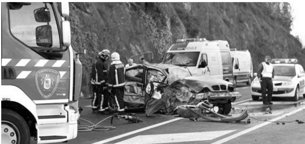
Imagen del accidente ocurrido el pasado miércoles.