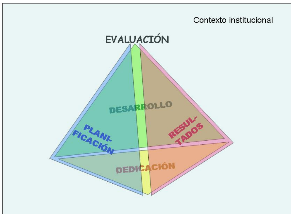
Figura 3. Dimensiones de evaluación de la actividad docente.

Las dimensiones consideradas se desagregan en los siguientes elementos: