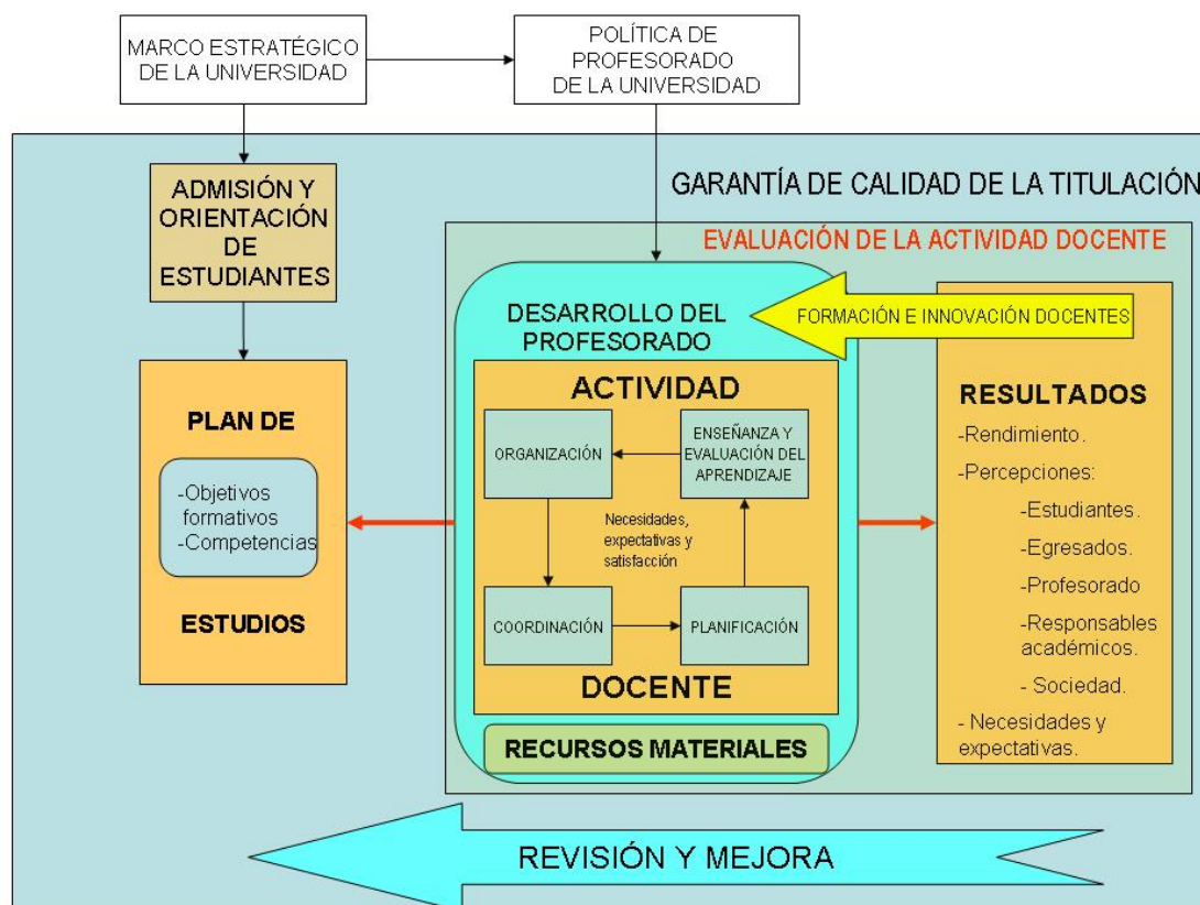
Figura 2. Plan de estudios y actividad docente

Los resultados de la actividad docente 5 se traducen en términos de los avances logrados en el aprendizaje de los estudiantes y en la valoración expresada en forma de percepciones u opiniones de estudiantes, egresados, responsables académicos y del propio profesorado.