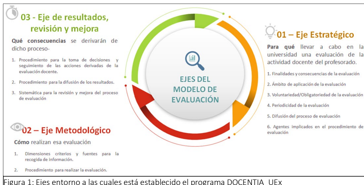
Figura 1: Ejes entorno a los cuales está establecido el programa DOCENTIA_UEx

Se trata de una evaluación individualizada de la actividad docente del profesorado que deberá realizarse garantizando el cumplimiento de los criterios de equidad, rigor técnico, objetividad, confidencialidad, transparencia y publicidad.